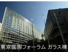
東京国際フォーラム ガラス棟